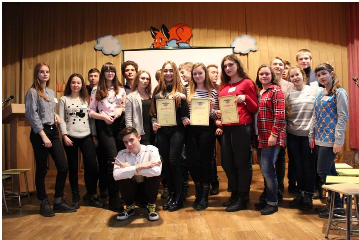
Змагання з баскетболу 2017-2018 навчальний рік. I місце в місті (3 роки поспіль), II - в області.