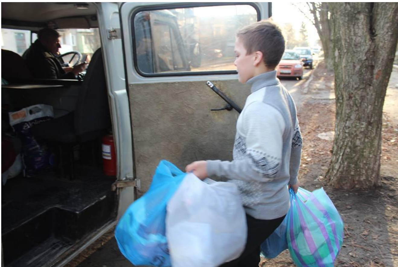
Благодійна акція «Волонтери - бійцям»

Благодійна акція до Дня інваліда «Волонтери дітям». Речі було передано до Союзу матерей та дітей інвалідів, до Співки Червоного Хреста та до Територіального центру соціальної допомоги.