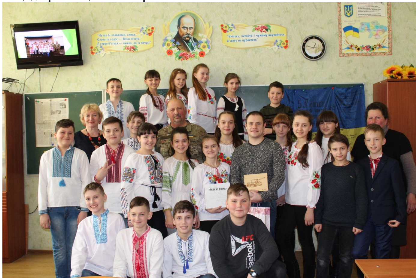
Кружок (Сокіл) Джура

До Дня добровольця відбувся патріотичний захід, куди були запрошені бійці-добровольці і волонтери.